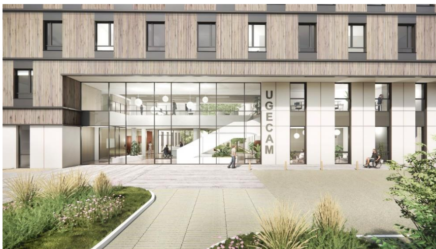
Un bâtiment sobre, élégant, compact, efficient et extensible