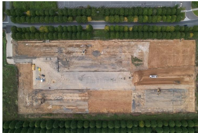
Le terrain du futur Hôpital de réadaptation de l'UGECAM Île-de-France sur le Carré Sénart

La signature de cet acte de vente illustre l'engagement concret des deux acteurs pour la conception d'un hôpital de réadaptation adapté aux défis futurs de la santé. Ce site stratégique assurera une accessibilité optimale pour les patients, leurs proches et les professionnels de santé.